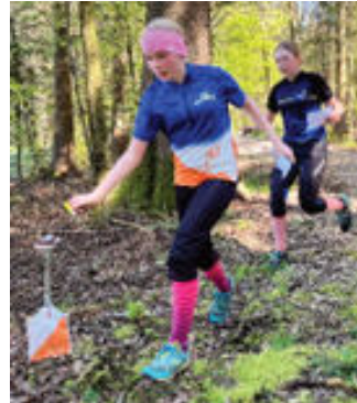
im Wald oder

in der Stadt, haben alle den vollen Einsatz gezeigt.