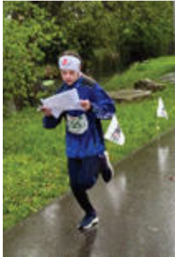
Ob bei Regen oder

Auch im vergangenen Jahr haben die NachwuchsläuferInnen fleissig Postenstandorte angelaufen.