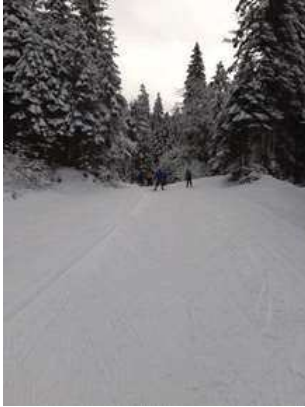
Unterwegs im winterlichen Suldtal